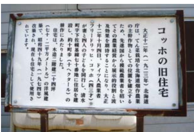
「コッホの旧住宅」の説明版