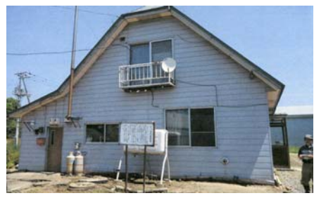
現在のコッホの旧住宅全景