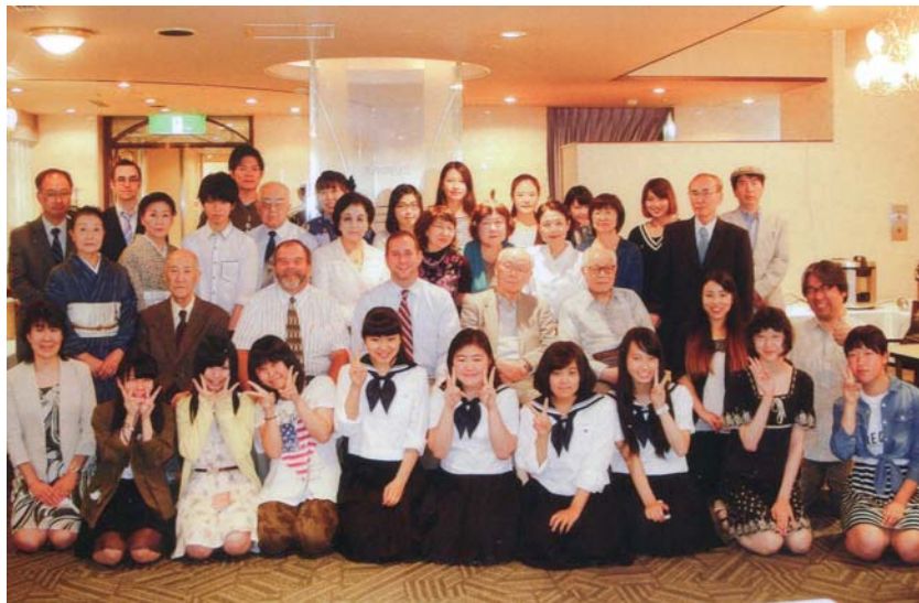
HOMAS International Exchange Luncheon 2015